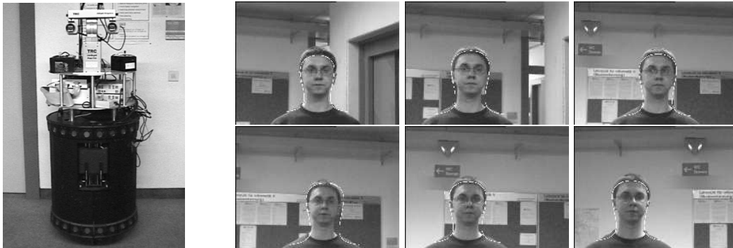
Abbildung 2: (links) Die für die Experimente verwendete mobile Plattform MOBSY, (rechts) Beispiel für eine Eskortierung; der zeitlichen Abstand zwischen zwei dargestellten Aufnahmen beträgt 5 Sekunden.

wird. Zur Vermeidung einer Kollision des Roboters mit möglichen Hindernissen wird mittels Infrarotsensoren die Entfernung zu den nächsten Objekten bestimmt. Liegt der Abstand unter einer festgelegten Schwelle, so werden alle Bewegungen der Plattform sofort eingestellt.